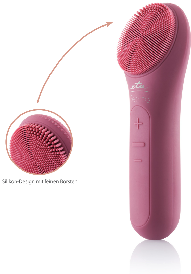
Silikon-Design mit feinen Borsten