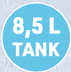
Kühlt & erfrischt mit reinem Wasser