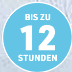
Laufleistung pro Tankfüllung