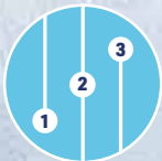
3 Geschwindigkeits- und Kühlstufen