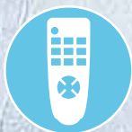
Inkl. praktischer Fernbedienung