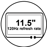
120 Hz Bildwiederholfrequenz