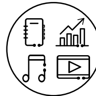
Eine Vielfalt an APPs wie zum Beispiel HUAWEI Notes