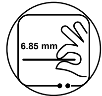
6,85 mm dünnes Metallic-Unibody