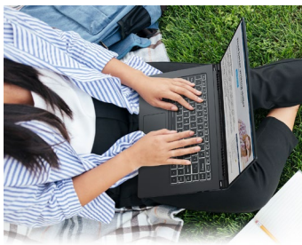
1,5 mm Tastenhub Beleuchtete Tastatur

Der Thunderbolt™ 4 Anschluss mit USB-4.0-Unterstützung sorgt für fortschrittlichste Konnektivität: Vom rasanten Datenaustausch mit bis zu 40 Gbit/s, über die Ansteuerung von Monitoren mit bis zu 8K-Auflösung bis hin zum universellen Anschluss eines USB-PD-Netzteils bietet der neue Standard maximale Flexibilität und Leistung.