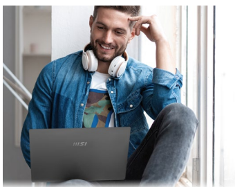
Brillanter Klang — bei Entertainment und Kommunikation

Die ergonomische Tastatur verwöhnt mit großen Tasten, einem angenehmen Anschlag und ideal bemessenem Tastenhub. Dank der weißen Tastaturbeleuchtung bleibt die Tastenbelegung selbst bei eingeschränkten Lichtverhältnissen stets gut im Blick.