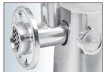
XXL-Auslassöffnung (6,5 cm) mit XXL-Verschlussring