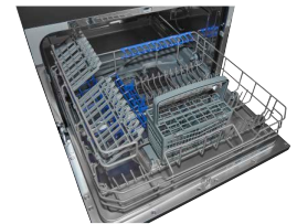
Geschirrkorb Übersichtlicher Geschirrkorb für mehr Ordnung