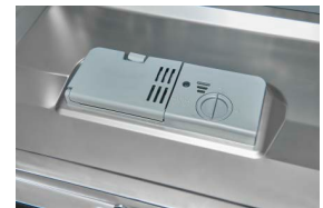
Dosiereinheit Genauere Dosierung des Spülmittels