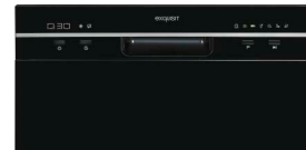
Bedienung Bedienpanel mit Restlaufanzeige